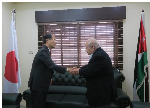
ラアド・ビン・ゼイド王子とのご挨拶