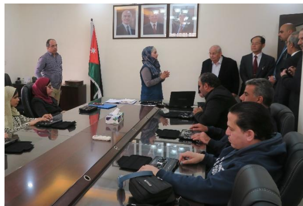
供与機材を使用した訓練の視察