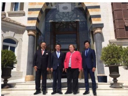
上院日ヨルダン友好議連との交流