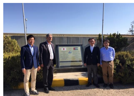
ザイ浄水場の視察