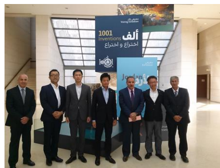
ヨルダン博物館視察