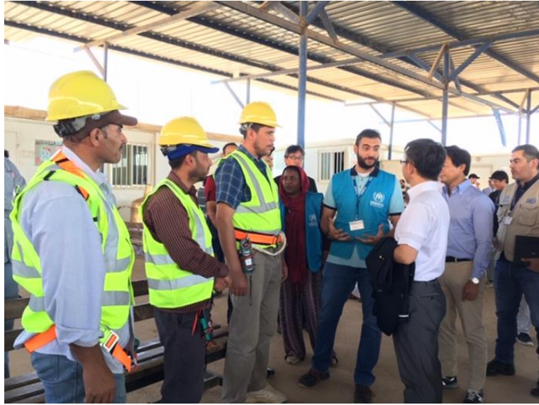
シリア難民キャンプ内で働く難民の方々との交流（JICA電力研修の修了生）