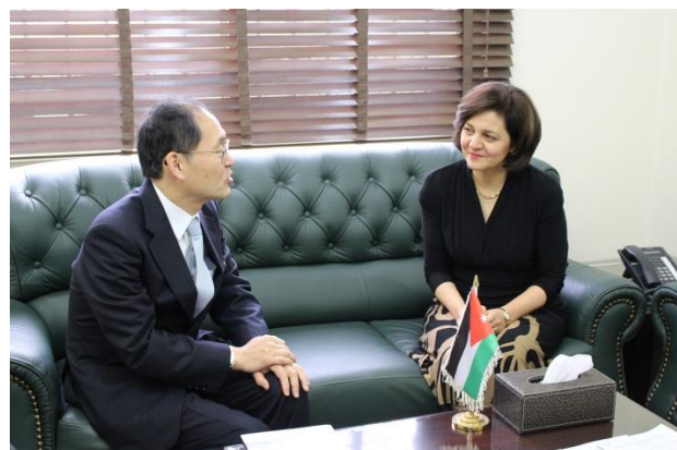
ラトーフ社会開発相との会談