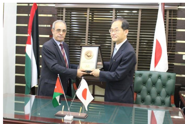
被供与団体から記念品の贈呈