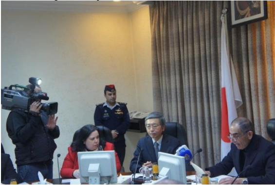
Speech by the Minister of Interior