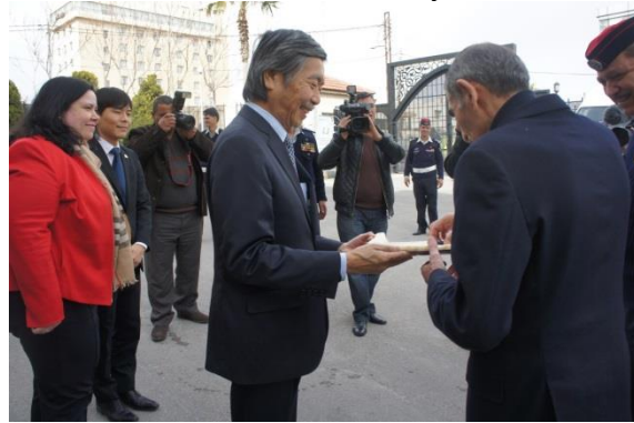
Handover of the keys