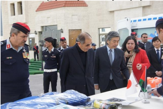
Medical equipment provided by the project